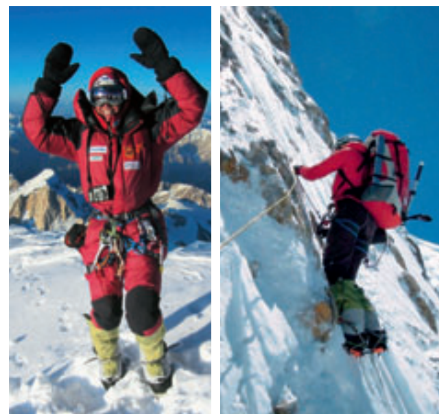
Gerlinde Kaltenbrunner bei ihrem Gipfelsieg