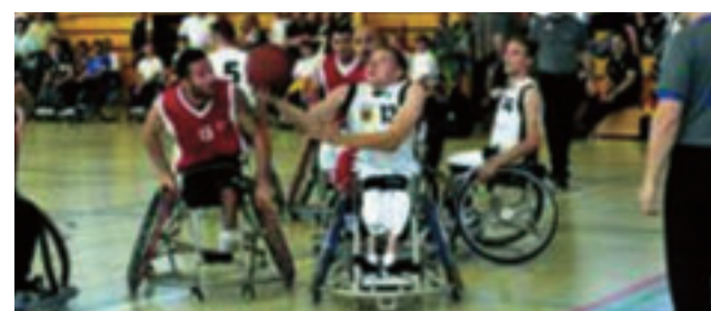
Banner - starker Partner des RSV Lahn-Dill