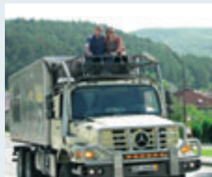
Mit der Buffalo Bull auf Weltreise

Die neue absolut wartungsfreie Buffalo Bull SHD PROfessional zeichnet sich durch einen speziellen Batterieflachdeckel mit patentiertem 4-Kammern-Auslaufschutz und Zentralentgasung aus. Maximale Auslaufsicherheit ist so garantiert. Vier Exemplare dieses Kraftpakets gehen jetzt auf eine ungewöhnliche Tour: Banner